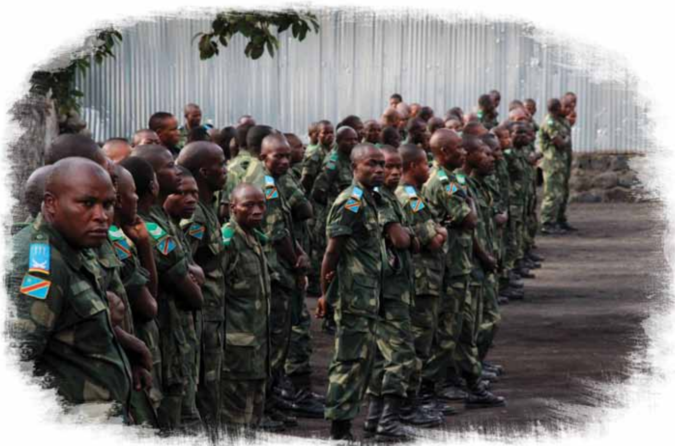
Les troupes des FARDC se rassemblent avant une inspection.