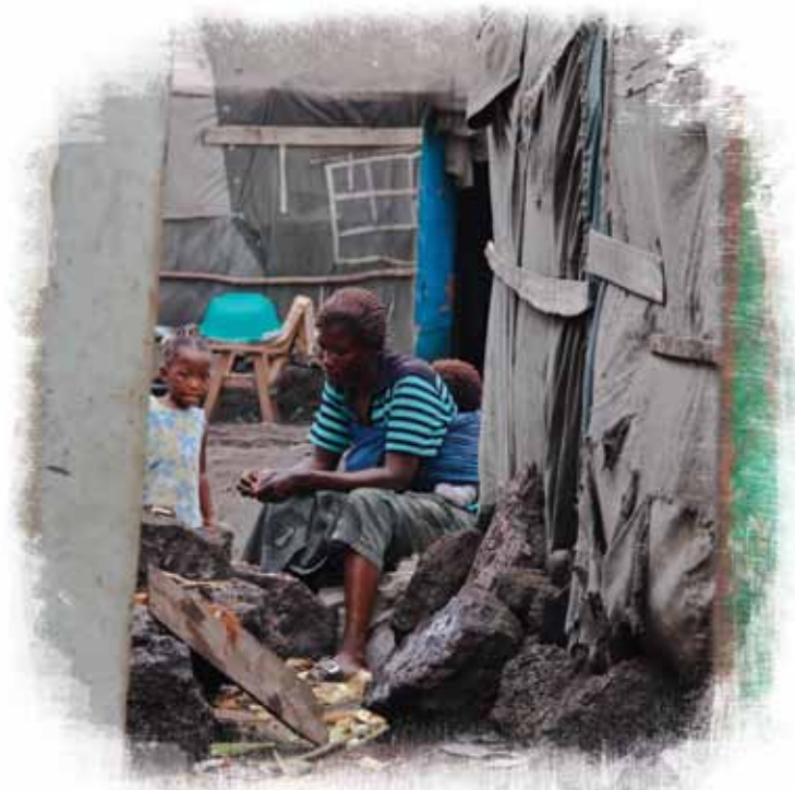
Une famille de militaire vivant au camp Katindo, dans le Nord Kivu. Le camp a des allures de bidonville et la plupart des familles vivent dans des tentes de réfugiés.

28. Il incombe à la communauté internationale de reconnaître cet impératif. Il lui faut également agir. Tous les autres objectifs – humanitaires, économiques, sécuritaires ou de développement – seront difficiles voire impossibles à atteindre sans RSS concertée. Les partenaires externes de la RDC doivent prendre une position collective sur une réforme sérieuse du secteur de la sécurité, tant pour générer une volonté politique que pour soutenir les processus de réforme congolais qui en découleront. Le gouvernement congolais bénéficie depuis la fin de la guerre d'un soutien financier et diplomatique significatif. Il convient aujourd'hui de tirer parti de tous ces engagements.