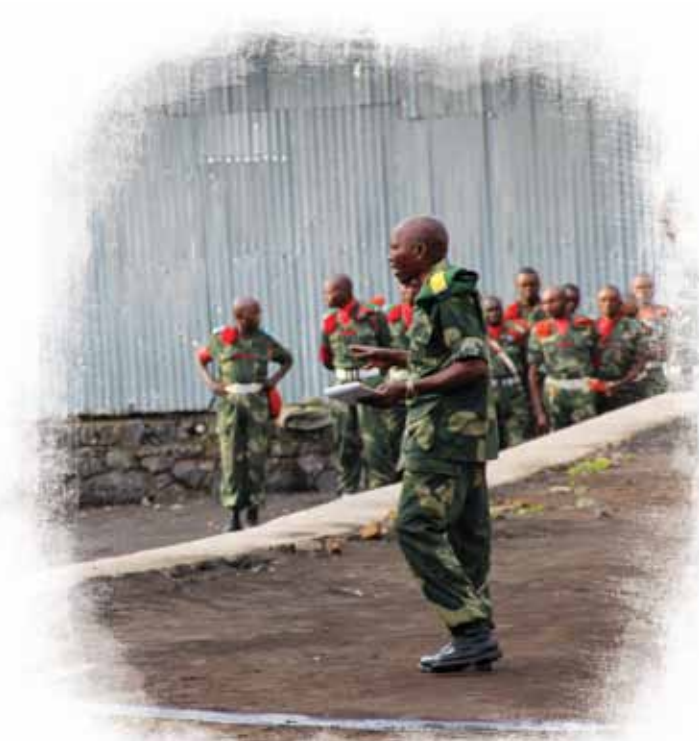
Un commandant passe ses troupes en revue. Le non-respect des structures de commandement militaire fait partie du quotidien de l'armée.

15. Par ailleurs, loin de pouvoir être qualifiée de pays « post-conflit », la RDC a continué de subir des accès de violence extrêmement graves. Durant la période qui a suivi les élections de 2006, des vagues soudaines et successives de conflits ou de tensions régionales ont conduit la communauté internationale à tenter de résoudre des crises politiques de courte durée ou