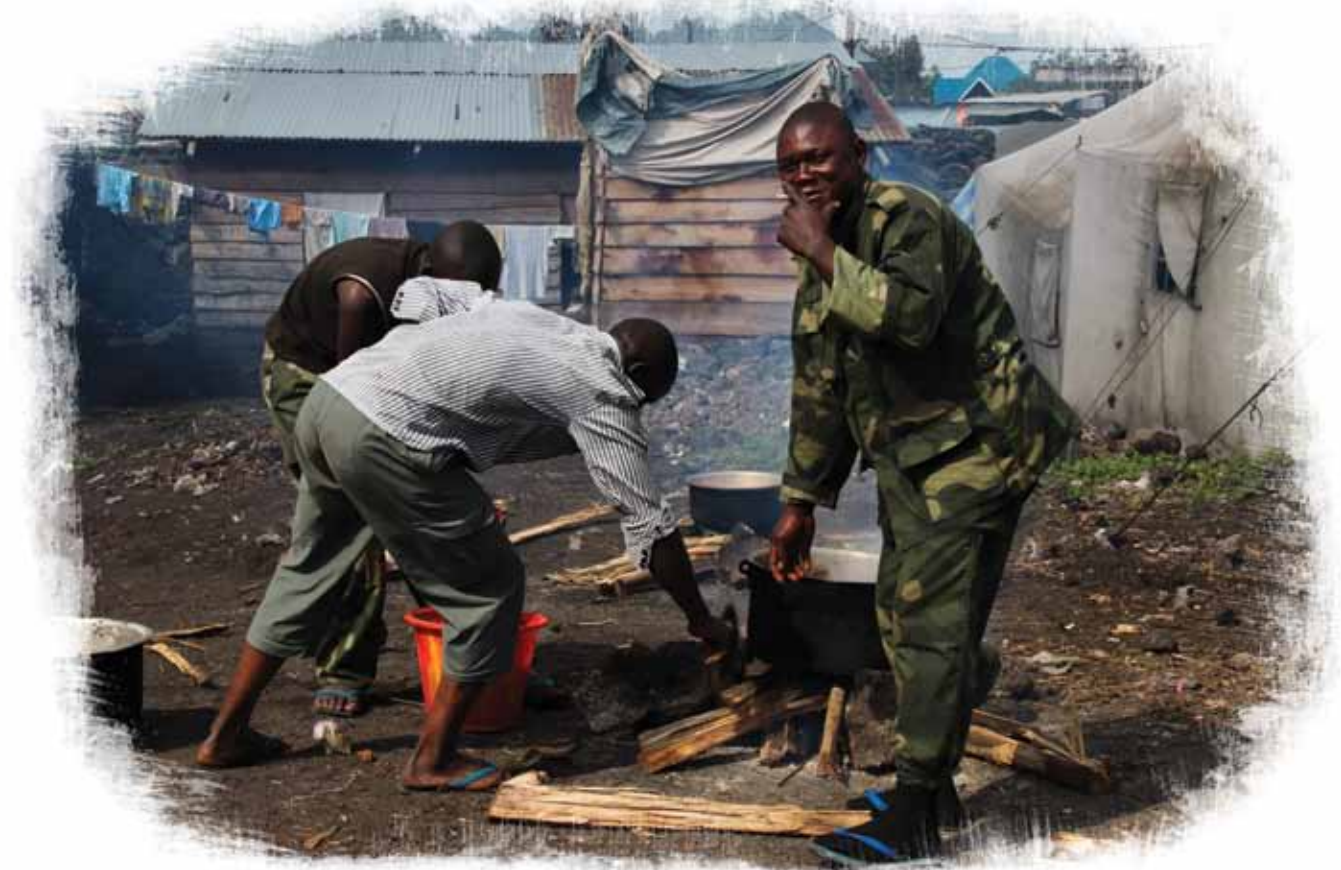
Des soldats préparent leur déjeuner sur un feu de camp. De nombreux militaires ne disposent pas du matériel réglementaire, comme les bottes.