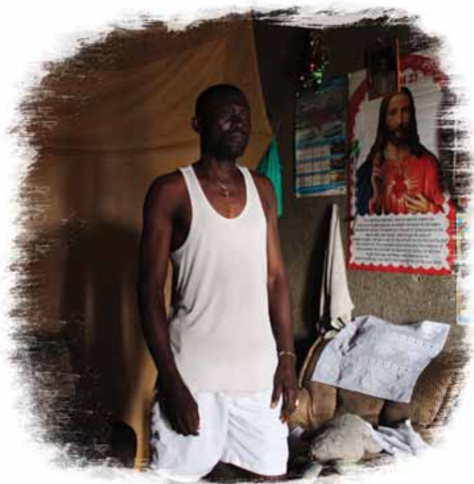
Un soldat dans sa caserne au camp Katindo, à Goma.

44. De plus, plus de 30 000 enfants ont été démobilisés avec succès depuis 2006 grâce à des interventions menées de concert avec le gouvernement congolais, les agences des Nations unies et les organisations locales. Les enfants et adolescents qui intègrent des groupes armés, que ce soit par la force ou par ignorance, rencontrent des difficultés au moment de leur démobilisation lorsqu'ils retournent au sein de leurs familles et de leurs communautés. Les programmes de désarmement, démobilisation et réintégration soutenus par l'UNICEF se démarquent par la réunion entre le démobilisé et sa famille ou sa communauté et par l'offre de formation professionnelle 82 .