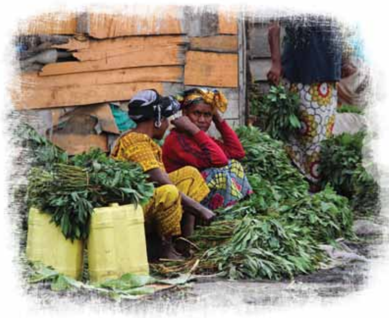
Pour faire vivre leur famille, les femmes de militaires doivent recourir au petit commerce. « Nous sommes obligés de nous débrouiller avec la population civile, de demander à nos connaissances de nous aider. L'Etat ne nous soutient pas du tout », raconte un soldat.