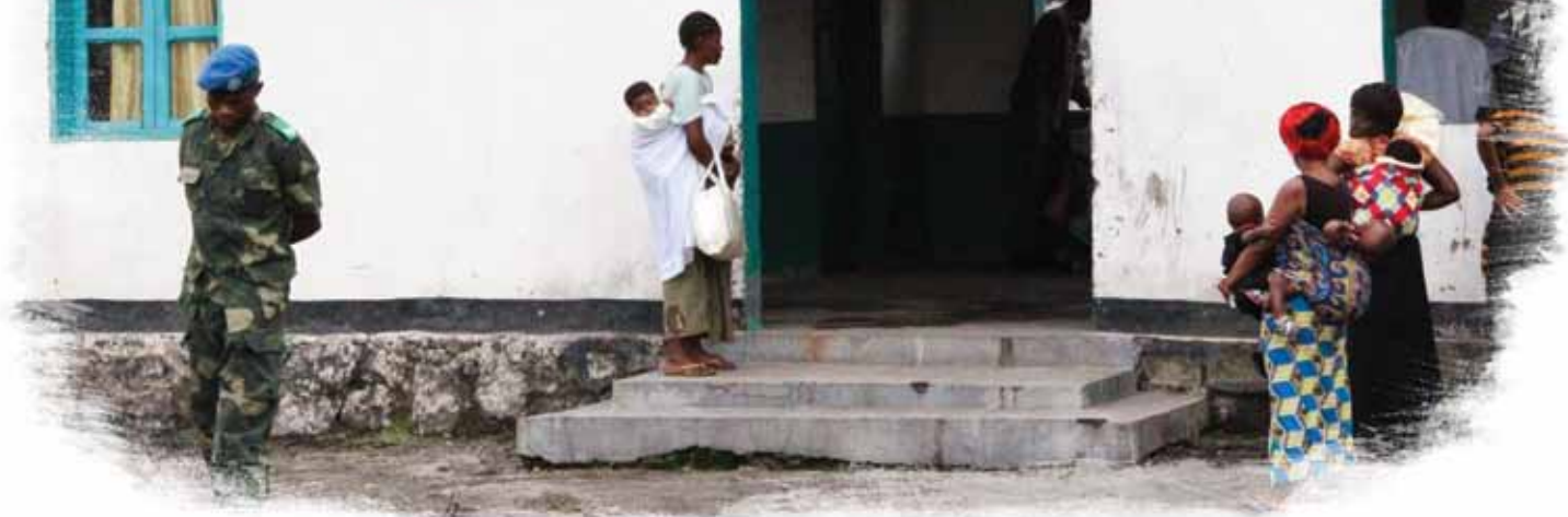
L'hôpital du camp fournit des soins médicaux de base aux familles de militaires.