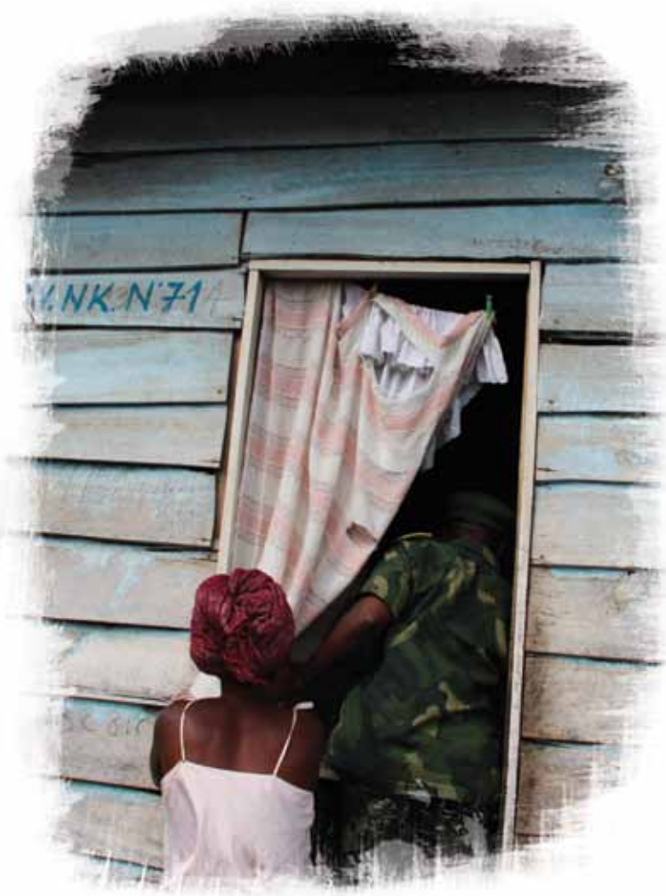
Quartier des officiers au camp Katindo à Goma, dans la province du Nord Kivu. Au départ, le camp était prévu pour accueillir environ 150 personnes, mais aujourd'hui, plus de 16 000 personnes y vivent, dont beaucoup de familles de soldats.

8. Bien entendu, cela est en partie imputable à un manque de capacité, ainsi qu'à la faiblesse du plan de base dédié à la réforme. L'intégration d'anciens belligérants au sein de structures militaires et policières unifiées pendant la période de transition, processus connu sous le nom de « brassage », a été incomplète et inefficace 35 . Des chaînes de commandement parallèles ont survécu dans l'armée et au sein d'autres structures de sécurité, et des dizaines de milliers de combattants sont restés au sein de groupes armés non étatiques. Le contrôle administratif assuré par le gouvernement a été faible, notamment dans l'est du pays. L'administration post-2006 s'est immédiatement retrouvée confrontée à divers opposants armés 36 . Signalons en outre une forte sensibilité à l'ingérence internationale sur les questions de sécurité – la surveillance étroite qu'avait exercée la communauté internationale pendant la période de transition, mise en application par le CIAT 37 et la MONUC, a suscité une frustration, voire une humiliation, considérable. Un souvenir cuisant a été laissé par l'occupation à l'époque où le pays était en guerre, occupation instaurée par des pouvoirs largement perçus – à tort ou à raison – comme agissant pour le compte d'éléments de la communauté internationale 38 . Le gouvernement défend jalousement son autonomie et rechigne à traiter collectivement avec la communauté internationale.