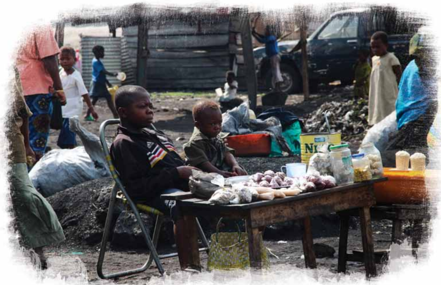
Le maigre salaire des militaires ne leur permet pas toujours de scolariser leurs enfants et ceux-ci sont mis à contribution pour faire vivre la famille.

9. Ces problèmes sont tout autant imputables aux échecs répétés de la RSS qu'ils en sont la cause. Ils ne permettent en aucun cas d'ignorer le besoin d'une RSS. Il n'en demeure pas moins que le gouvernement congolais s'est sans cesse abstenu d'offrir un soutien politique suffisant à un changement digne de ce nom. Surtout, il n'a pris aucune mesure pour mettre un terme à la corruption endémique, au manque de discipline et à la faiblesse des structures de commandement qui nuisent aux efforts de réforme dans le secteur de la sécurité. Malgré la déclaration à fort retentissement du Président Kabila en juillet 2009, annonçant une « tolérance zéro » à l'égard de la violence sexuelle et de la corruption, la situation sur le terrain n'a que trop peu évolué. Le soutien accordé à la justice, aux enquêtes et à la lutte contre la corruption est minime et manifestement inadéquat – le ministère de la Justice s'est ainsi vu attribuer seulement 0,1 % des dépenses gouvernementales en 2011 39 , et son budget aurait chuté de 47 % de 2007 à 2009. 40 De nombreux individus qui occupent un poste à responsabilité au sein du gouvernement ou de l'armée continuent de profiter de la corruption, que ce soit en se servant sur les salaires, en prélevant des pots-de-vin, en prenant part à l'exploitation ou au commerce illégal des minerais, ou encore en rackettant les gens en échange d'une protection.